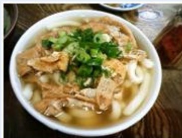
「みやけうどん」の麺は極太で、伝統的な博多のうどんです。