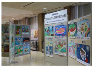
北九州市役所1階ホールでの展示風景