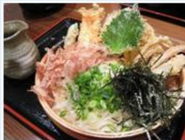
野菜の天ぷらがてんこ盛りの「うどん和助」の野菜天うどん。