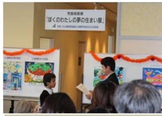
北九州市市長賞の表彰