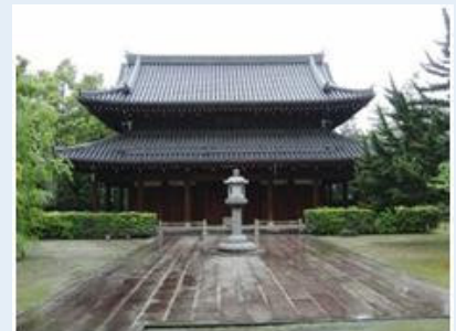
うどん発祥の地、承天寺の境内

まずは最近注目の豊前裏打ち会系のうどんから。有名なのは、西区上山門の「うどん大地」（092-891-6040）。ごぼう天うどんが圧巻です。裏打ち会系のもう一店は、城南区鳥飼の「うどん和助」（092-851-0070）。お昼時は行列ができてます。天神西通りにまだ何にも無かった50年前から営業をしている「大福うどん」（092-781-6731）は、昔ながらの博多うどんです。ここは、鍋料理の“博多うどんすき”が名物です。博多駅界隈のビジネスマンに人気が高いのが「うどん平」（092-431-9703）。つるつるとした喉越しが人気です。うどん発祥地の承天寺のそばにある「みやけうどん」（092-291-3453）は、五木寛之の小説「青春の門」にも登場した老舗です。最後は、太宰府インターのすぐ近くにある行列店の「狐狸庵」（092-503-1202）。ここはうどんも美味しいですが、かつ丼も大人気です。