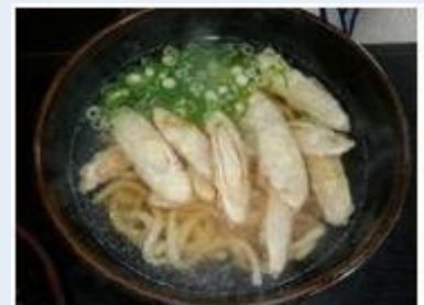
駐車場がいつもいっぱい「狐狸庵」は麺も丼もお勧めです。