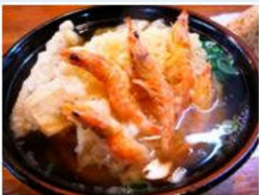
「うどん平」のお勧めは海老天とごぼう天を乗せた海老ごぼう。