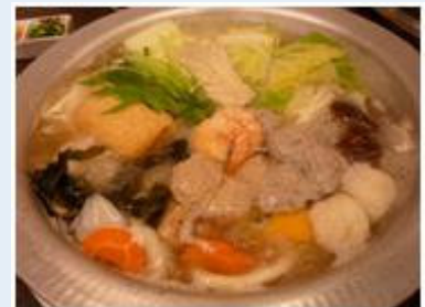
いくら煮込んでも麺が煮崩れない「大福うどん」のうどんすき。