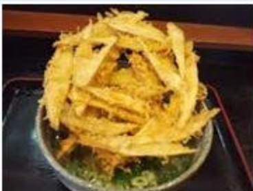
その大きさにびっくりする「うどん大地」のごぼう天うどん。

まずは最近注目の豊前裏打ち会系のうどんから。有名なのは、西区上山門の「うどん大地」（092-891-6040）。ごぼう天うどんが圧巻です。裏打ち会系のもう一店は、城南区鳥飼の「うどん和助」（092-851-0070）。お昼時は行列ができてます。天神西通りにまだ何にも無かった50年前から営業をしている「大福うどん」（092-781-6731）は、昔ながらの博多うどんです。ここは、鍋料理の“博多うどんすき”が名物です。博多駅界隈のビジネスマンに人気が高いのが「うどん平」（092-431-9703）。つるつるとした喉越しが人気です。うどん発祥地の承天寺のそばにある「みやけうどん」（092-291-3453）は、五木寛之の小説「青春の門」にも登場した老舗です。最後は、太宰府インターのすぐ近くにある行列店の「狐狸庵」（092-503-1202）。ここはうどんも美味しいですが、かつ丼も大人気です。