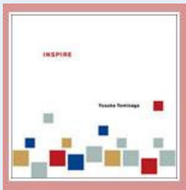
インスパイアのジャケット

で、今月の街あるき食べあるきは、うどん編です。博多はうどん発祥の地と言われてますが、うどん屋さんの情報は意外に少ないような気がします。今回は、私の知っている美味しいうどん屋さんをご紹介します。